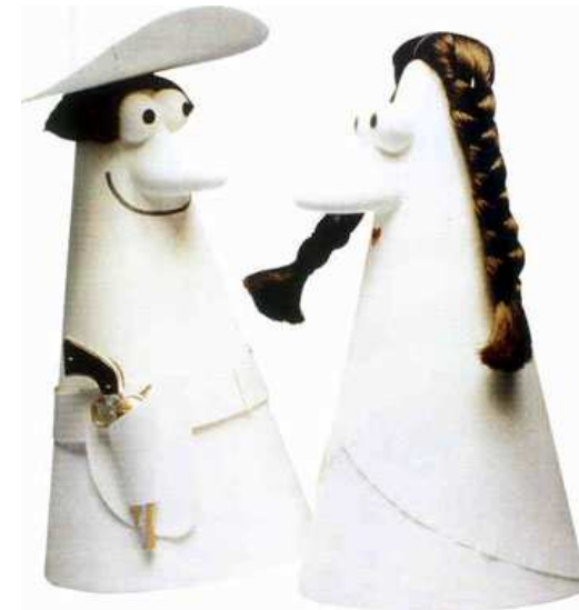
Carmencita ed il Caballero misterioso nelle pubblicità del caffè Lavazza