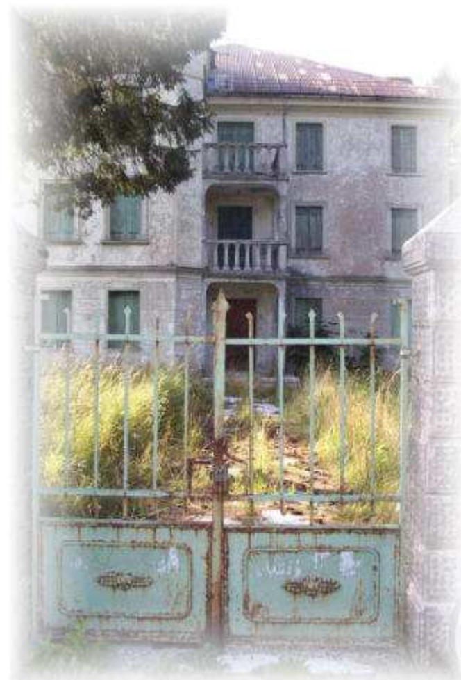
Orsodream 2 "Il risveglio" Gennaio 2005 Orso Max